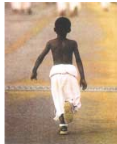
SOPRA: pellegrini in preghiera nella Moschea di Makkah. CENTRO: Tende per i pellegrini. IN BASSO: Un bambino con indosso l'irham (veste composta da due pezzi di stoffa di cotone bianco) segue i pellegrini durante l'Hajj.

e Marwa, come fece Hagar, moglie di Abramo, mentre era alla ricerca dell'acqua per suo figlio Ismaele. Poi i pellegrini si raccolgono nell'ampia spianata di Arafat e si uniscono in preghiera per impetrare il perdono divino, cosa che viene spesso vista come anticipazione del Giudizio Universale. Nei secoli passati, compiere l' Hajj era un'impresa veramente ardua.